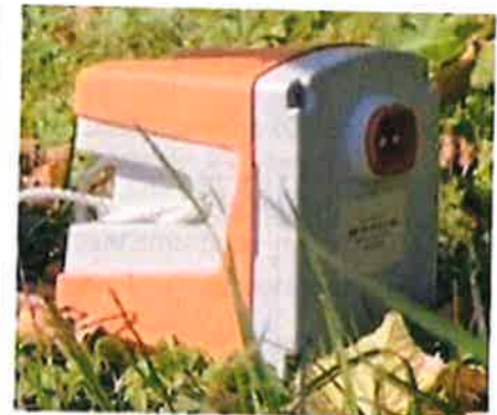
GÉOPHONE Boîtier de 11 x 11cm

Les géophysiciens reconstituent ensuite l'image du sous-sol, à partir de l'analyse des signaux enregistrés.