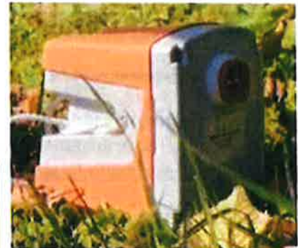
GÉOPHONE Boîtier de 11 x 11cm

Les géophysiciens reconstituent ensuite l'image du sous-sol, à partir de l'analyse des signaux enregistrés.